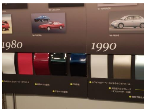
年代ごとに、カラーリングも変化

これらは、世の中の流行をあとから追いかけるというより、私たち塗料メーカー側が世の中の動向の一步先までを見つめ、「次はこんな色が、好まれるのではないか？」と想像しています。それをクライアント様に提案し、デザイナーらと話し合って採用色を決めるという具合です。塗料がそこまでやるの？とお感じになるかもしれませんが、世の中の消費者の感覚は敏感ですから、こうしたカラーリングの視点を提示するのも、弊社の社会的使命だと思っております。これらは、トイレにもこれから広がる考え方かもしれません。