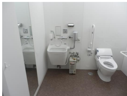
実際に壁に塗布されたトイレ。とても消臭効果があるとは気がつかないほど、自然で落ち着きがある。