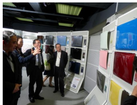
色の可能性を広げる