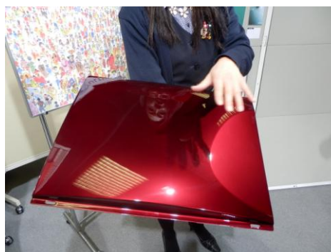
人気沸騰の「マツダの赤」（マツダ車の人気車種）のコンセプトは、なんと「りんご飴」だそうです。