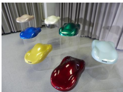
未来の車はこうなる??