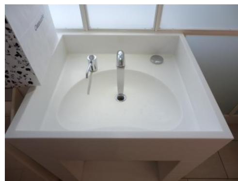
囲みのある、洗面台。水跳ねが広がらない。

2つ目はドアの鍵の部分です。ここに鉄板を貼付し、鍵の開閉時についてしまう傷をつけ