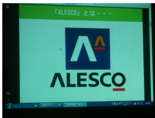
この企業マークが目印です

主な売上は、グループ会社を含めると2940億円です。内訳は、自動車分野が30%で最も多く、国内を走っている自動車の2台に1台が弊社の塗料が塗られている計算になります。そのあとは、工場分野が26%と続きますが、この26%の中に、トイレ関連メーカーとして有名なTOTO様やLIXIL様も含まれております。これ以外に建築分野（26%）。自動車補修分野（7%）と続きますが、みなさまにとって意外ながらも身近なのは、ビールの缶の内側に塗っている塗料かもしれません。例えば「一番搾り」（麒麟株式会社）という有名な銘柄の缶の内側には、ビールの味をより美味しく保つ特殊な塗料が塗られております。こうして話すと、塗料は案外身近な存在だと、お気づき頂けるのではないかと思います。